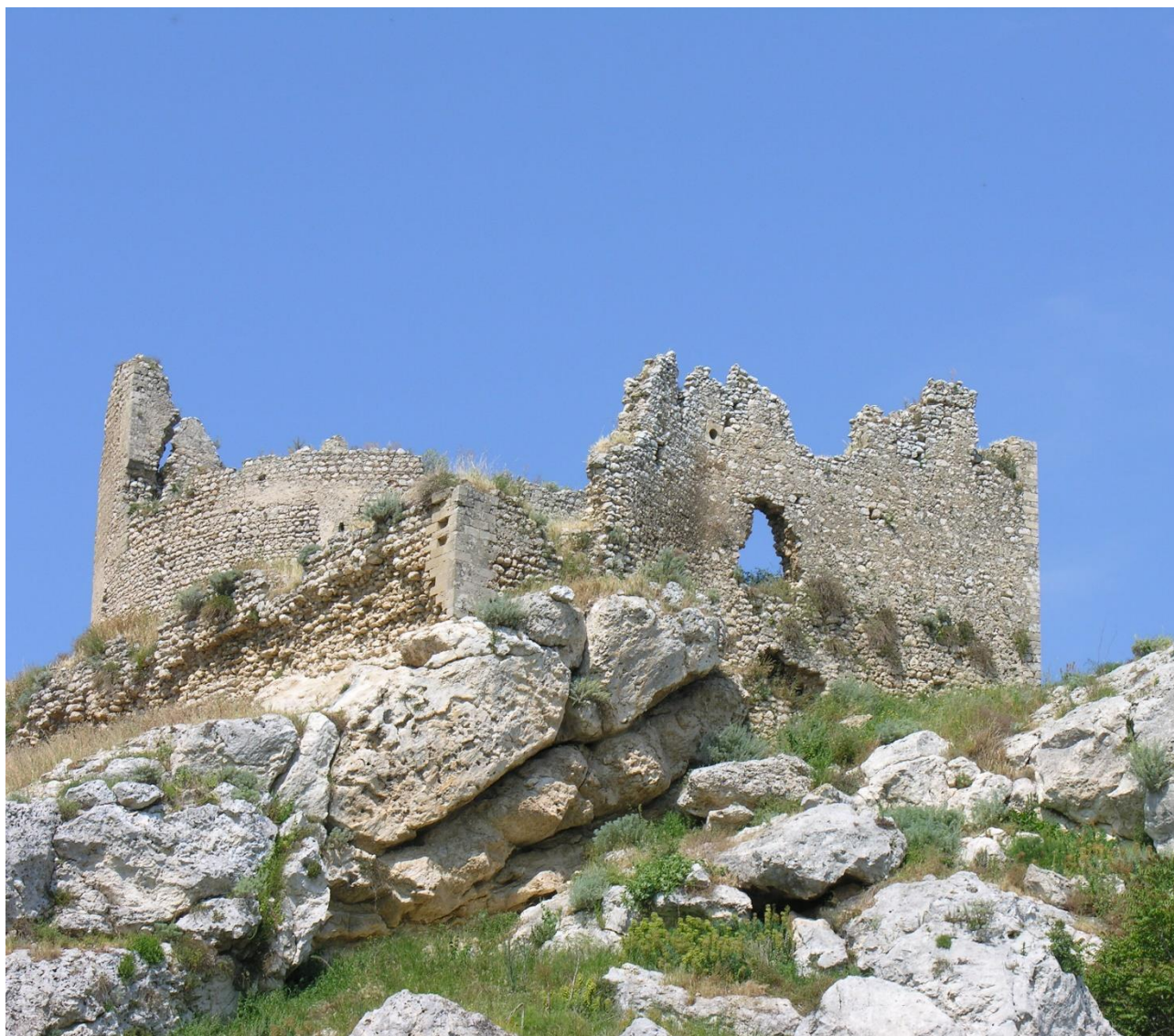
Sopra . I ruderi del castello di Mongialino in territorio di Mineo (Catania).